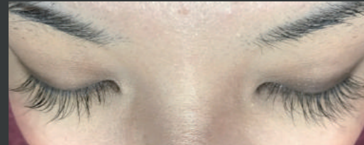
40代女性 ホームケア2ヶ月半 サロンケア1回