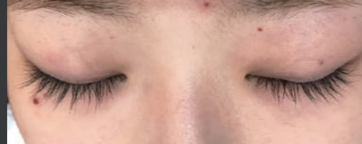
30代女性 ホームケア3ヶ月 サロンケア1回