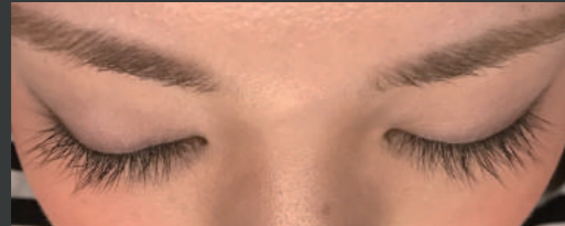
20代女性 ホームケア1ヶ月半 サロンケア1回