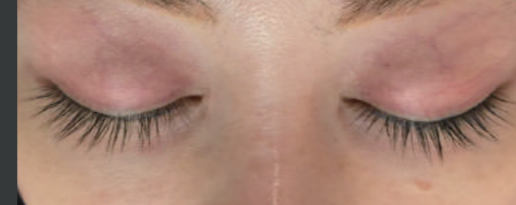
30代女性 ホームケア2ヶ月 サロンケア1回